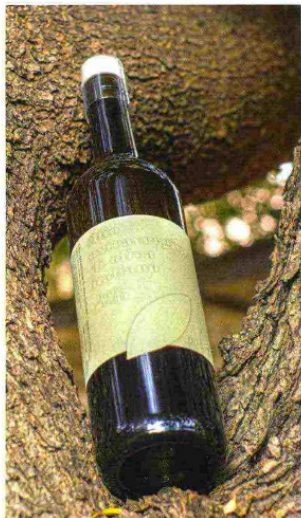
Da sinistra in alto: il vigneto Vigna Nica; una bottiglia di olio extravergine d'oliva ad alta percentuale di vetro riciclato con etichetta ricavata da scarti di olive; l'Etna visto dall'azienda agricola Virzi di Cesarò; colori d'autunno nel vigneto.